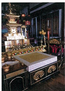
那須猊下お座りの礼盤 (成就院)